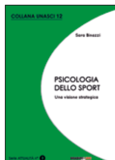
Collana UNASCI n. 12 n. 3 ATTUALITÀ (copertina verde) PSICOLOGIA DELLO SPORT Una visione strategica Sara Binazzi (prefazione di Fino Fini)