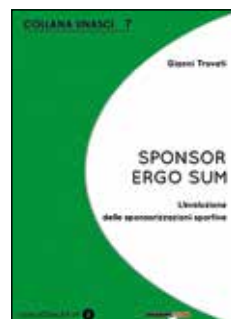
Collana UNASCI n. 7 n. 2 ATTUALITÀ (copertina verde) SPONSOR ERGO SUM L'evoluzione delle sponsorizzazioni sportive Gianni Trovati (prefazione di Matteo Olivetti)