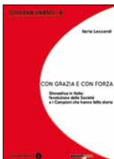
Collana UNASCI n. 6 n. 2 STORIA (copertina rossa) CON GRAZIA E CON FORZA Ginnastica in Italia: l'evoluzione delle Società e i Campioni che hanno fatto storia. Ilaria Leccardi (prefazione di Riccardo Agabio)