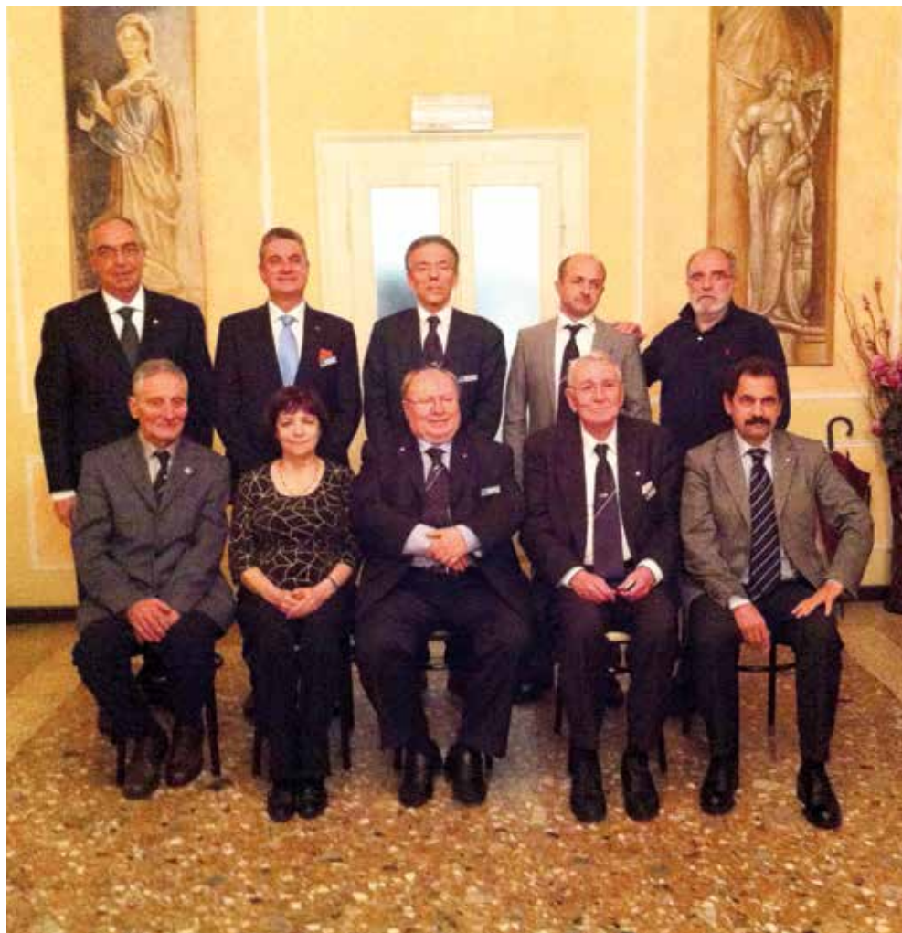
Il Consiglio Nazionale UNASCI 2013-2016