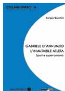
Collana UNASCI n. 4 n. 1 CULTURA (copertina blu) GABRIELE D'ANNUNZIO L'INIMITABILE ATLETA Sport e super-omismo Sergio Giuntini (prefazione di Claudio Gregori)