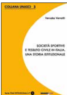
Collana UNASCI n. 3 n. 1 TEMI ISTITUZIONALI (copertina gialla) SOCIETÀ SPORTIVE E TESSUTO CIVILE IN ITALIA, UNA STORIA ISTITUZIONALE Veruska Verratti (prefazione di Francesco Bonini)