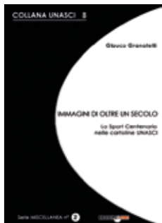
Collana UNASCI n. 8 n. 2 MISCELLANEA (copertina nera) IMMAGINI DI OLTRE UN SECOLO Lo sport centenario nelle cartoline UNASCI Glaucio Granatelli (prefazione di Pierangelo Brivio)