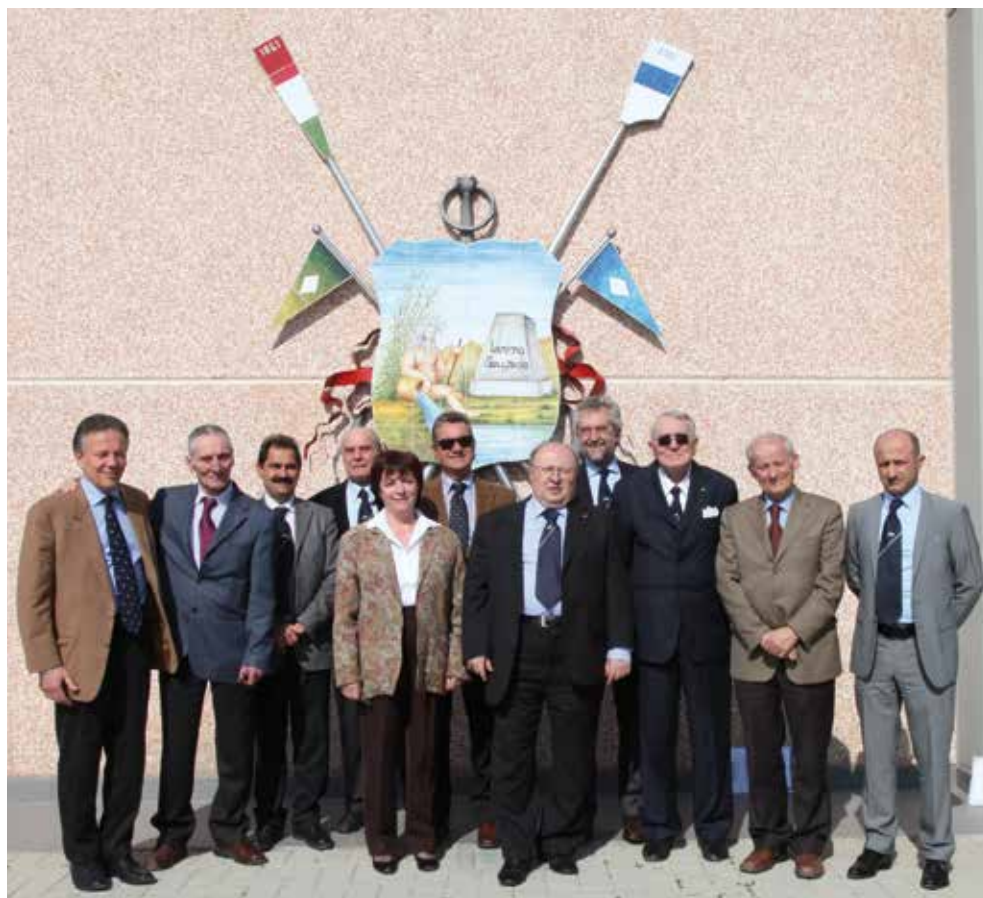
Il Consiglio Nazionale UNASCI 2009-2012